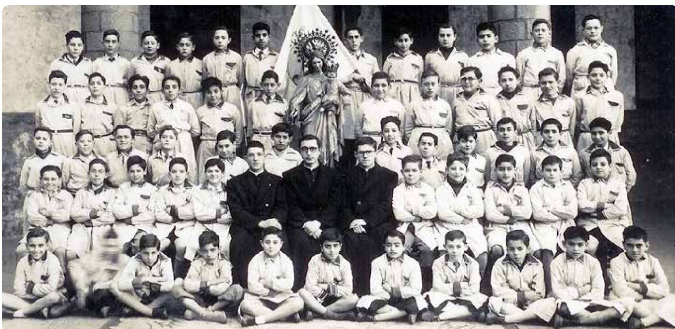
Foto de grupo de la promoción 1952-53

Bajo el lema “Un sueño, una vida, una sonrisa” los Salesianos de Rocafort, celebran su 125º aniversario (1890–2015). Un aniversario acompañado por el reconocimiento del ayuntamiento de Barcelona, que recientemente les ha concedido la Medalla de Honor de la ciudad “por su contribución a la formación de las personas y en favor de su dedicación a los más necesitados”. Así pues, la comunidad educativo-pastoral de Rocafort está de fiesta y desde octubre del año pasado realiza diferentes actos, actividades y celebraciones en el marco de este aniversario tan especial y emotivo, que ha coincidido también con el bicentenario del nacimiento de San Juan Bosco.