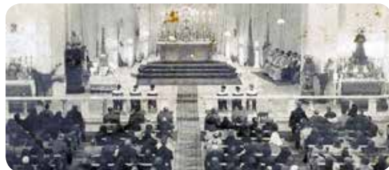
Inauguración del Santuario de María Auxiliadora