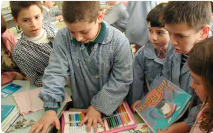
Alumnos trabajando en clase