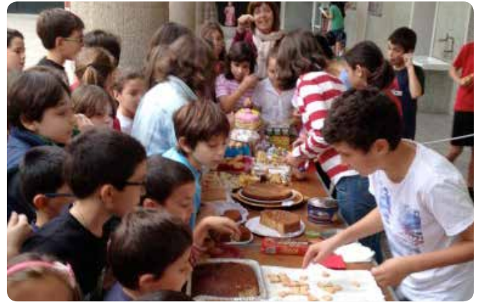
Desayuno solidario para proyectos de cooperación al desarrollo