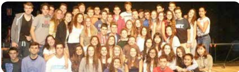
Alumnos en el teatro, en una ponencia sobre superación personal.

En esta construcción, el uso de las tecnologías en el aula es clave, ya que proporciona una puerta abierta al mundo y además, les ayuda a adquirir unos hábitos y unas competencias necesarias en la sociedad actual. Los jóvenes de hoy en día necesitan dominar tanto las lenguas propias como el inglés. Esto supone concebir el aprendizaje de las lenguas como una tarea transversal.