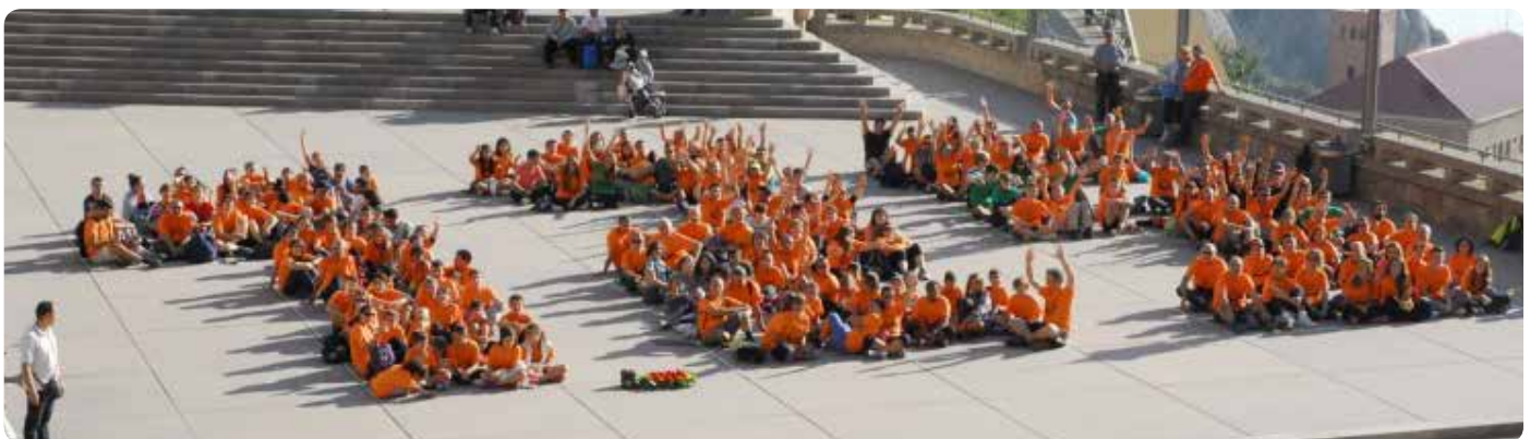
Mosaico de los 125 años en Montserrat

Coincidiendo con la celebración del 125 aniversario hemos comenzado la implantación de un proyecto que hemos titulado “Conectados para aprender (CXA)” que quiere vertebrar las acciones a llevar a cabo para