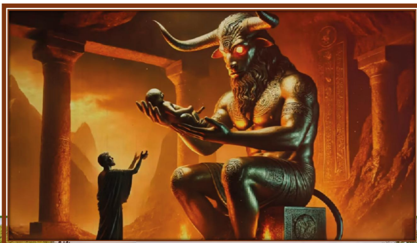
Imagen: Recreación del dios Molok sobre panorámica actual del parque Valle de la Gehenna.

El Valle de la Gehenna es actualmente un agradable parque en el que se realizan actividades culturales.