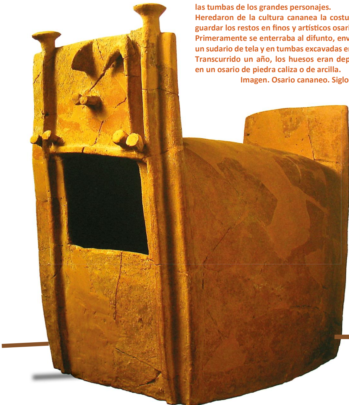
Imagen. Osario cananeo. Siglo XIV a. C.

Transcurrido un año, los huesos eran depositados en un osario de piedra caliza o de arcilla.