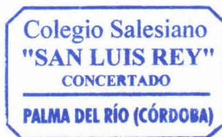
Sello del Centro

Nota: si el candidato no es contactado antes del 11 de junio de 2021 se entenderá que su solicitud no ha sido estimada.