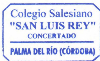
Sello del Centro

Nota: si el candidato no es contactado antes del 30 de noviembre de 2020 se entenderá que su solicitud no ha sido estimada.