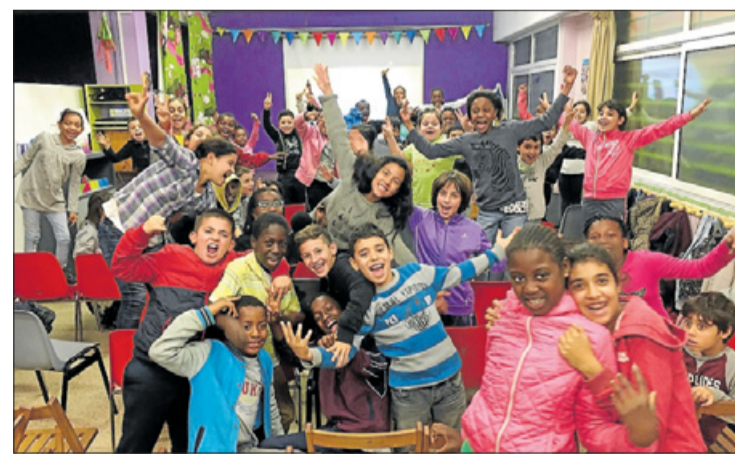
Una de les activitats amb els infants del barri.

A Santa Eugènia, els salesians han continuat amb la seva tasca de dedicació a la mainada. Entre els projectes que han endegat hi ha, per exemple, la dinamització de quatre centres oberts, que actualment compten amb 120 infants que hi acudeixen cada tarda per berenar, fer els deures i participar en programes educatius. També participen en el projecte Fem Feina, en coordinació amb els Serveis Socials, per tal d'orientar els joves que no saben a què dedicar-se, ofereixen espais de